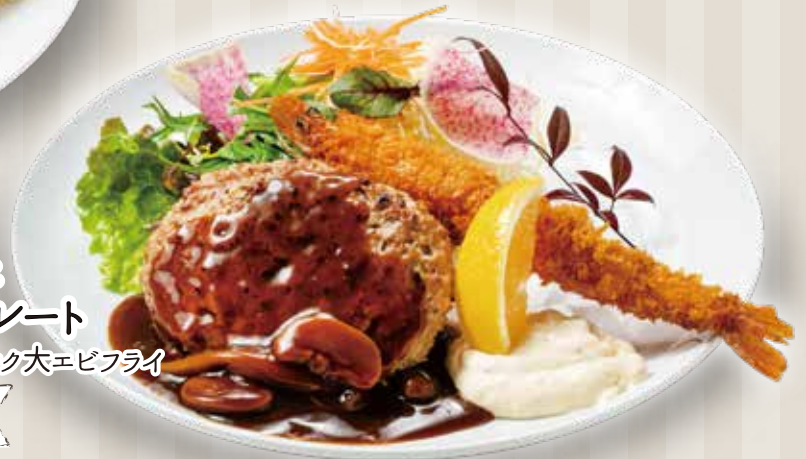
ハンバーグと 大エビフライのプレート