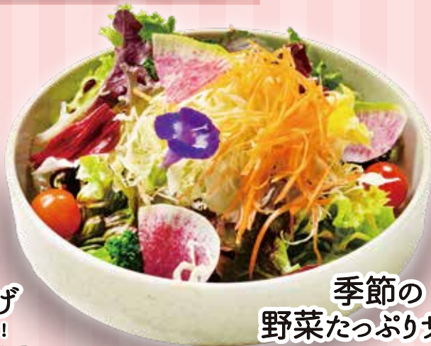
季節の 野菜たっぷりサラダ