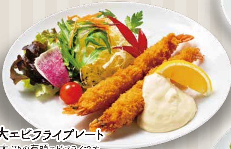
大エビフライプレート