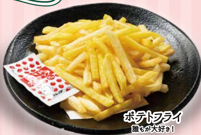
ポテトフライ 誰もが大好き!