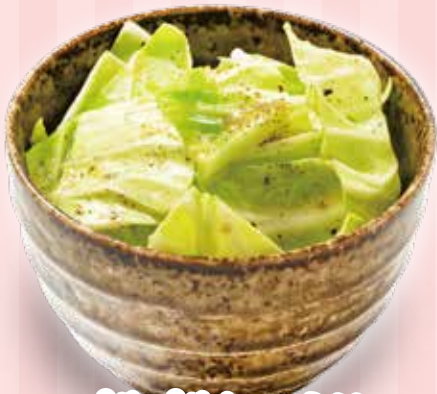
パリパリキャベツ