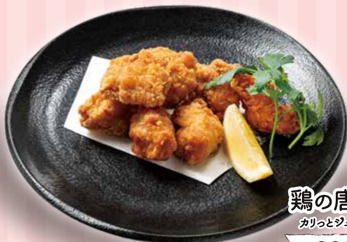
鶏の唐揚げ カリッとジューシー!