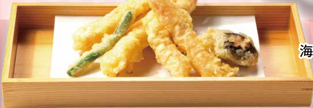
海老天ぷら盛り合わせ (抹茶塩付き)