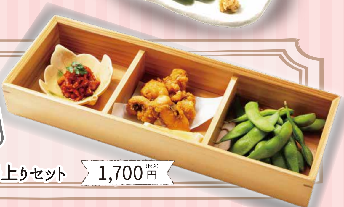
本日の湯上りセット